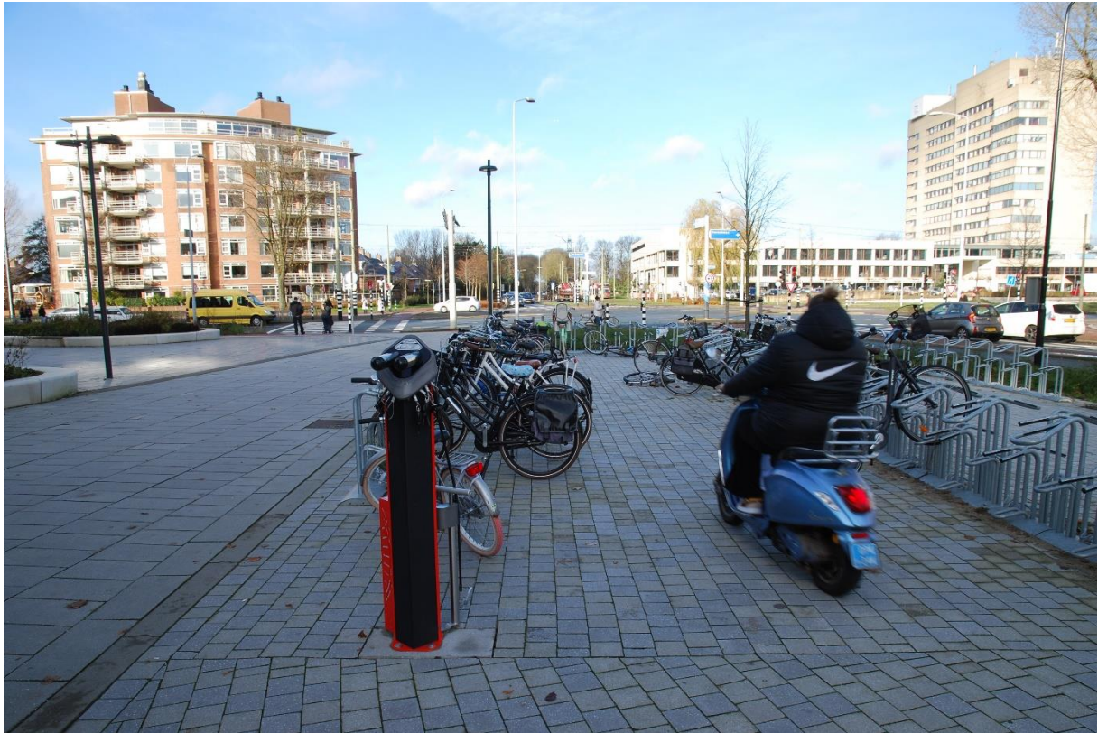
Fietsenstalling bij het mooiste en grootste winkelcentrum van Nederland

Fietsersbond, afdeling Leidschendam-Voorburg 10 januari 2022 Dick Bredeveld Rob Kniesmeijer