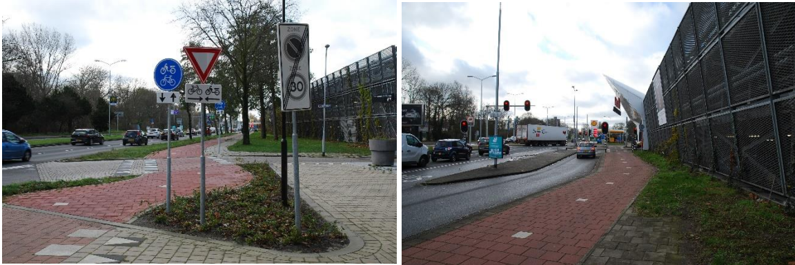
Noordsingel, bij de Banningflat en bij toegang parkeergarage Weigelia