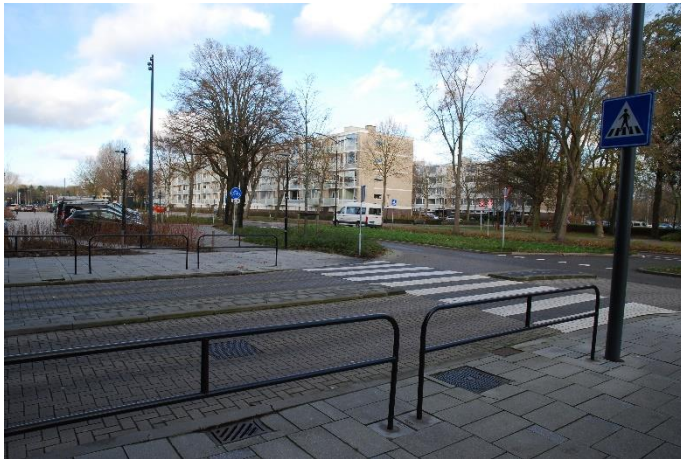
In- en uitrit parkeergarage aan de Burg. Banninglaan