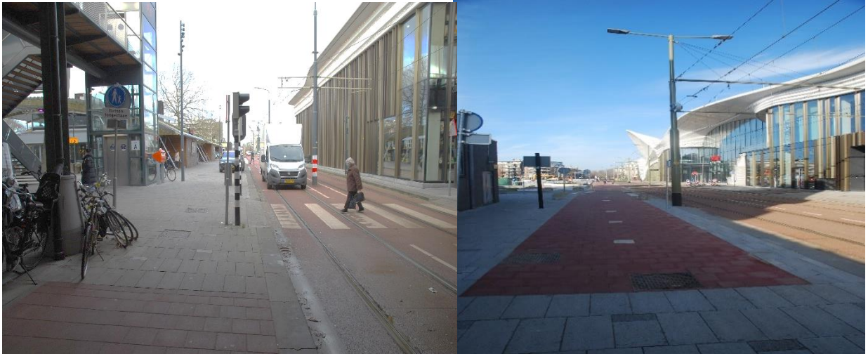
Tweemaal de Weigelia, bij de AH en bij de bioscoop.