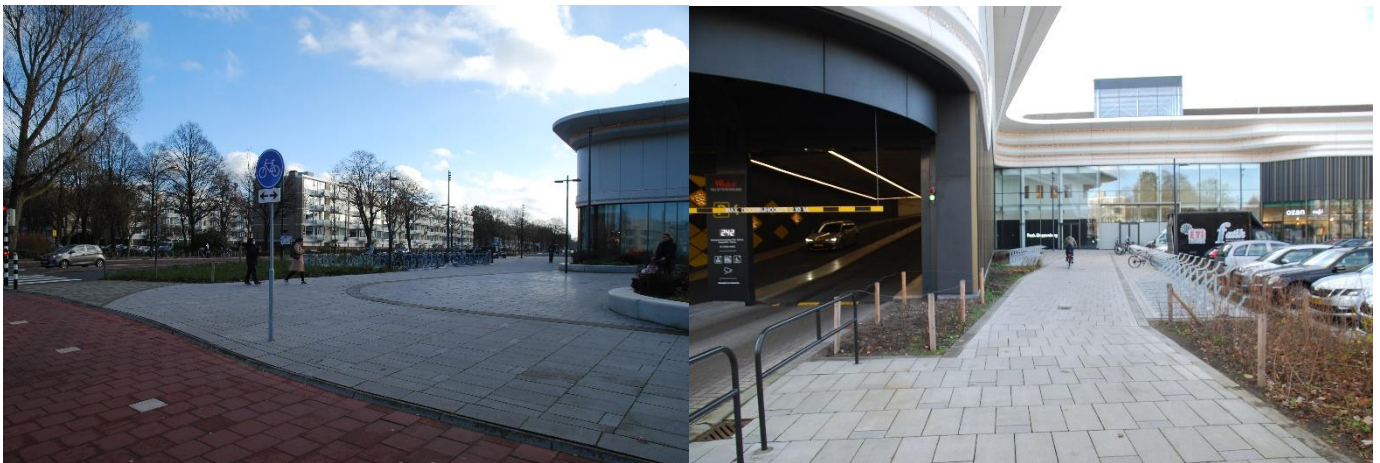
Fietsenstallingen Burg. Banninglaan